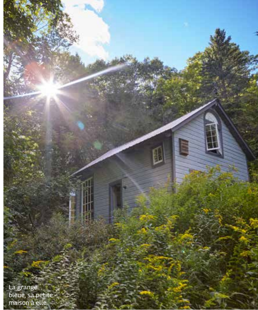
La grange bleue, sa petite maison à elle.