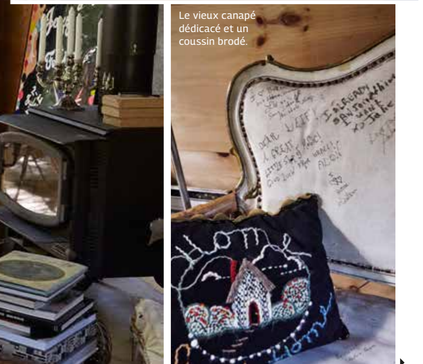
Le vieux canapé dédicacé et un coussin brodé.