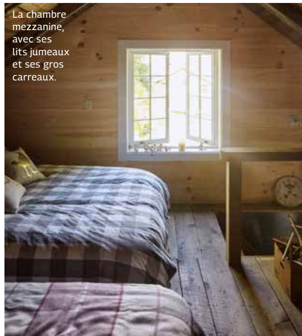
La chambre mezzanine, avec ses lits jumeaux et ses gros carreaux.