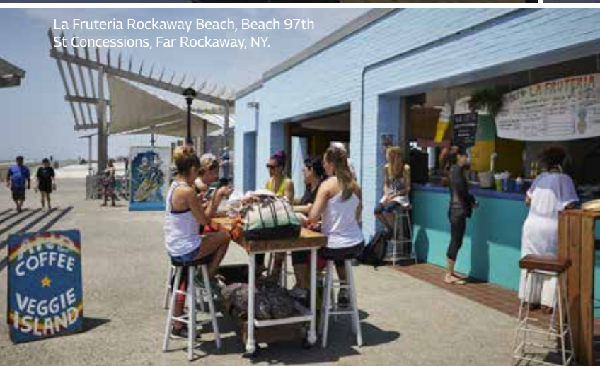
La Fruteria Rockaway Beach, Beach 97th St Concessions, Far Rockaway, NY.