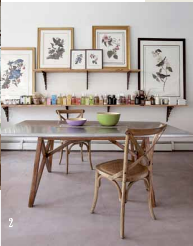
1. Phoenicia Diner. 2. La boutique Nest. 3. Une des cuisines de Graham & Co. 4. Le jardin de Graham & Co.

Sur l'autre rive de l'Hudson, Marina Abramovic travaille à son monumental centre d'art : OMA, l'agence de Rem Koolhaas, rénove un ancien bâtiment industriel de 1850 mètres carrés qui accueillera le public pendant un minimum de six heures pour une expérience esthétique «transformative» quasi mystique. Après avoir enfilé des chaussons blancs et mis leurs affaires au vestiaire, les visiteurs passeront par la «salle d'eau potable», où ils seront invités à boire un verre d'eau aussi lentement qu'ils le pourront, ou la «salle de regard», où ils se fixeront des yeux le plus longtemps possible. Il y aura aussi un espace dédié à la «méthode Abramovic» et des programmes de collaborations artistiques et de performances. Pas loin, à Hudson, la rockeuse Melissa Auf der Maur a transformé en 2007 une vieille bâtisse industrielle en paradis culturel underground, The Basilica, où elle accueille le tout-Brooklyn branché pour des soirées edgy. En été, elle organise le festival SoundScape, où des artistes invités tels que Sterling Ruby, Matthew Barney, Swans ou DIIV se retrouvent dans une ambiance festive. « On décrit souvent Upstate comme le "Wild West", explique-t-elle. Tous ceux qui viennent trouvent l'inspiration pour créer quelque chose de nouveau. C'est sauvage, tout est à faire. On est tous ici pour l'idée de communauté, on travaille ensemble, on s'entraide. Upstate, c'est le refuge des idéalistes. » ■